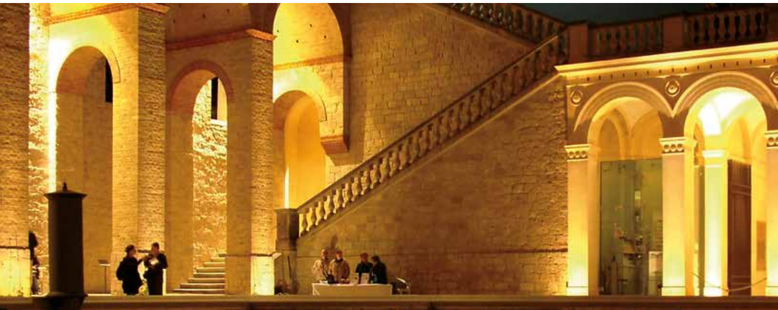
Festlich beleuchtetes Belvedere auf dem Pfingstberg

Glienicker Brücke, 12 Uhr Fördergemeinschaft »Lindenstraße 54« www.foerdergemeinschaft-lindenstrasse.de