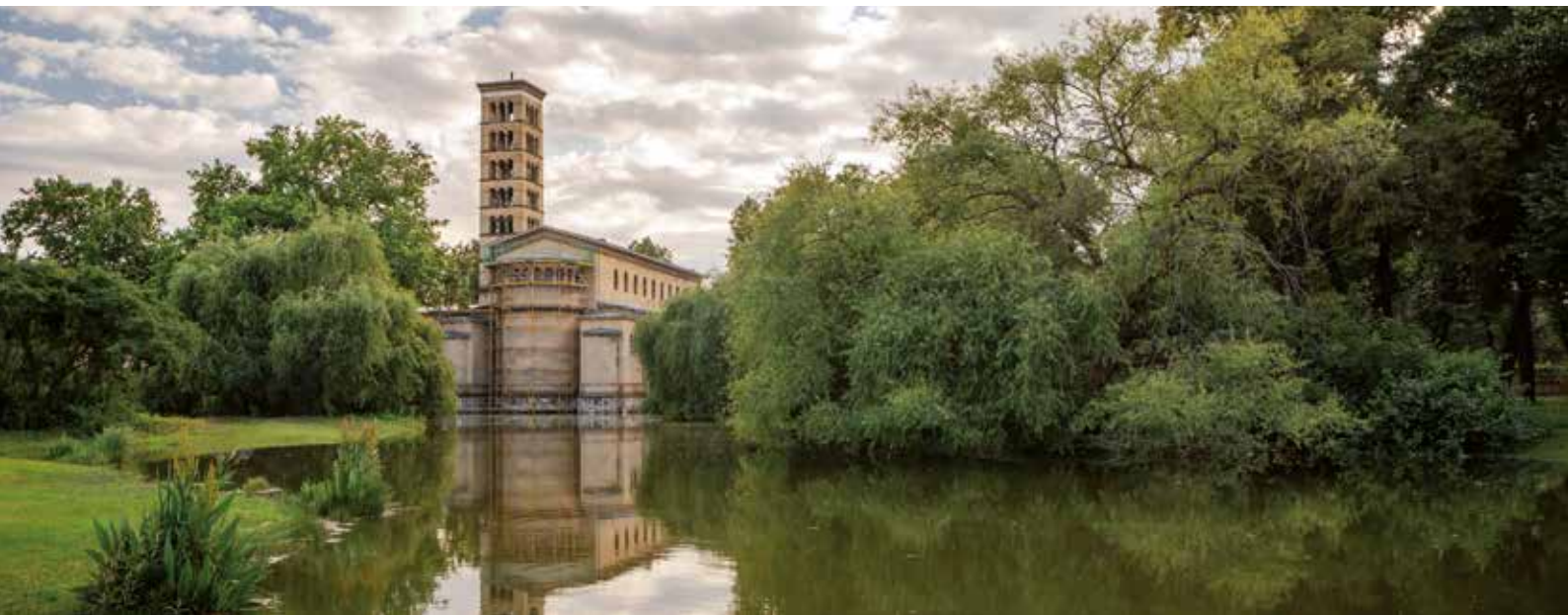
Friedenskirche im Park Sanssouci