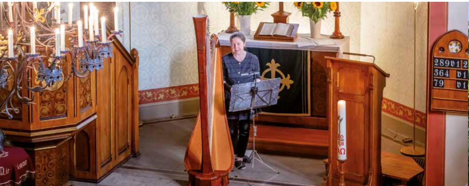
Kapelle in Klein-Glienicke