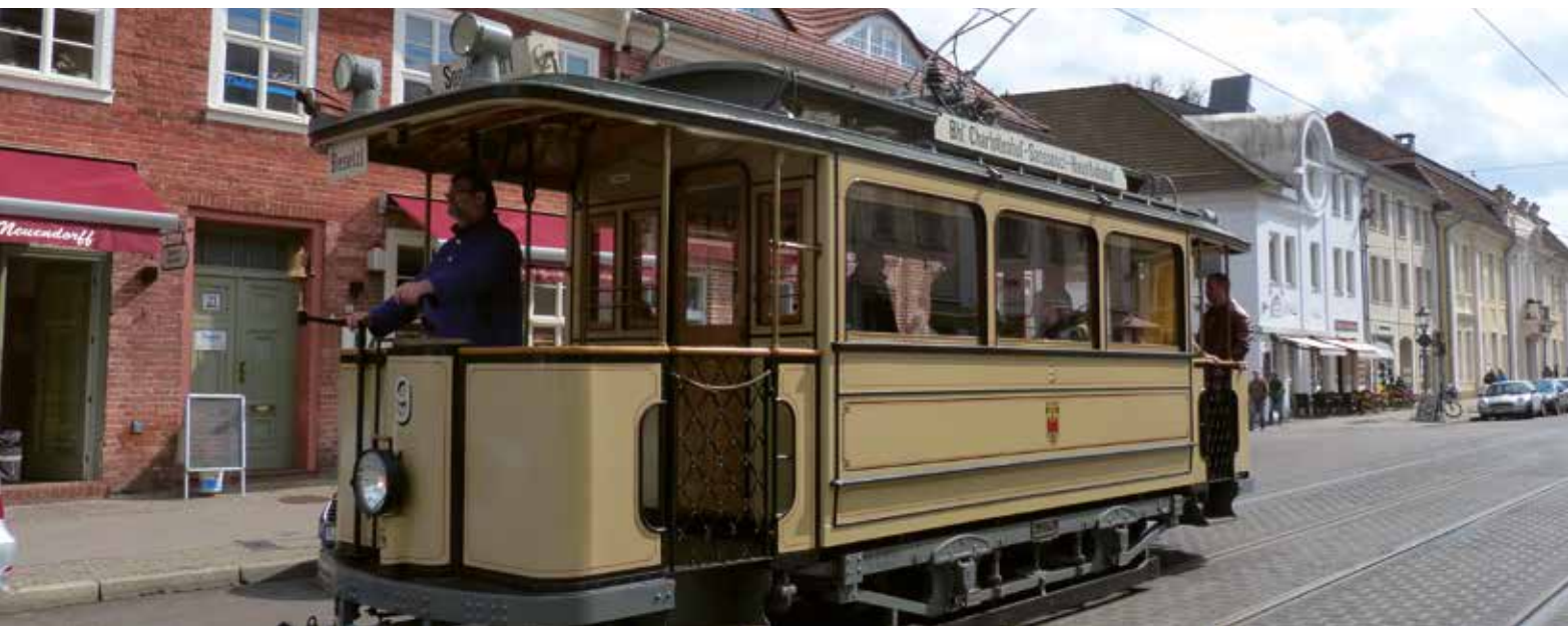
Historischer Lindner-Motorwagen Nummer 9

Theaterkomödie in der Gartenanlage in Koop. mit BerlinsBeste Pfungstberg Gartenanlage, 20 Uhr Förderverein Pfungstberg in Potsdam e.V. | www.pfungstberg.de