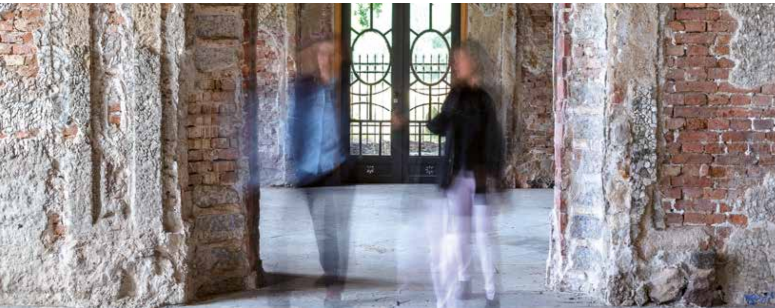
Muschelgrotte im Neuen Garten