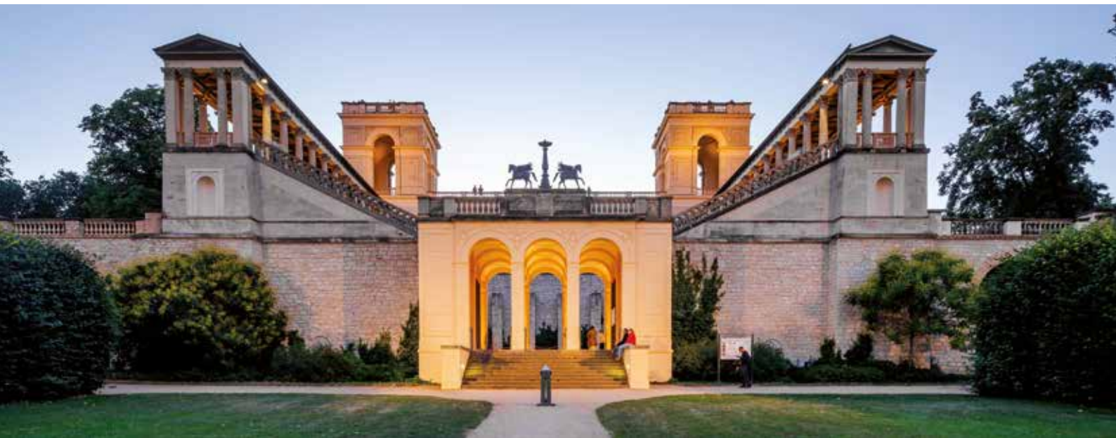
Belvedere auf dem Pfingstberg

Udo Beyer ist ein bekannter deutscher Leichtathlet. Er wurde 1973 Junioreuropameister. Im Erwachsenenbereich belegte er im Jahr darauf bei den Europameisterschaften Platz acht.