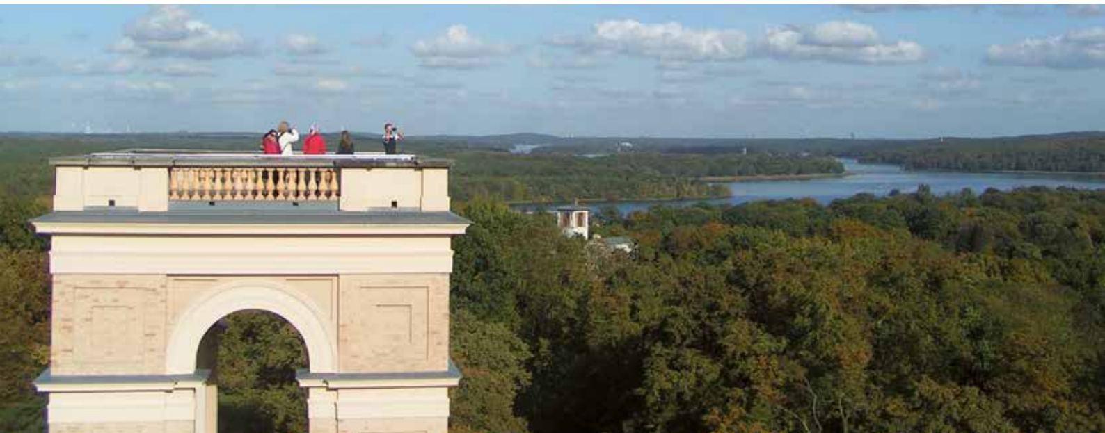
Turm des Belvedere auf dem Pfingstberg

Sagen, Mythen und Märchen aus der Mark Brandenburg mit Erzählern des BerlinBrandenburgischen Märchenkreis e.V., mit Spielen, Tanz und Musik, Kaffee und Kuchen vom Verein Pfingstberg Gartenanlage und Pomonatempel, 15 Uhr Förderverein Pfingstberg in Potsdam e.V. | www.pfungstberg.de