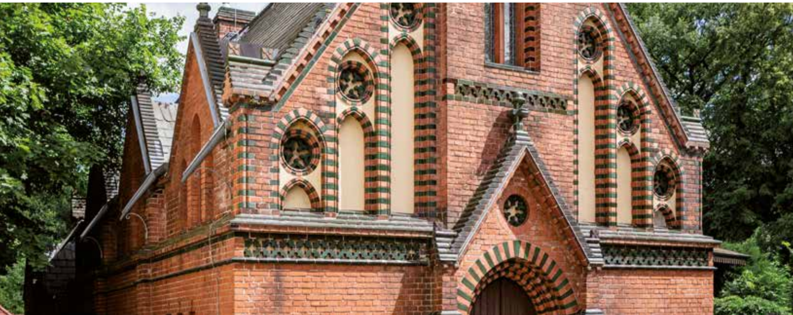
Detail Kapelle Klein-Glienicke

Alte Neuendorfer Kirche (Angerkirche), 16 Uhr Förderverein Alte Neuendorfer Kirche und Neuendorfer Anger e.V. www.alteneuendorferkirche.de