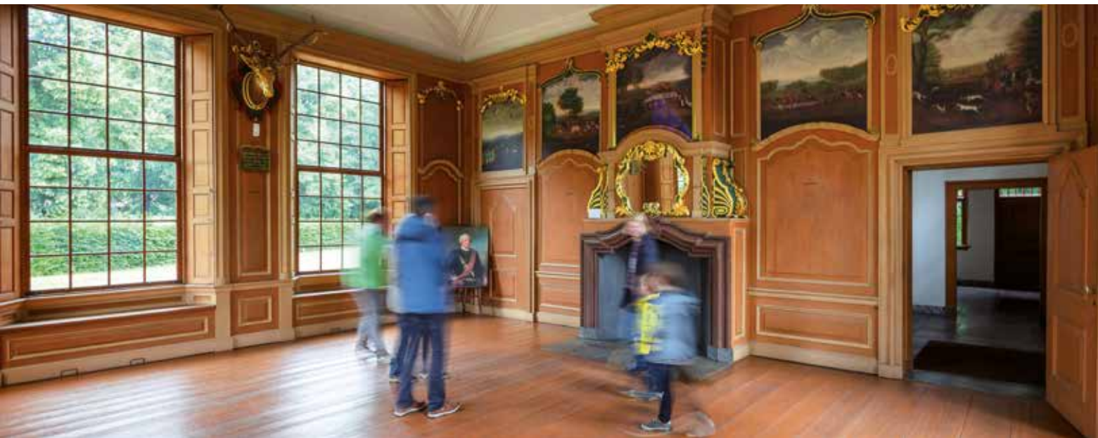
Jagdschloss Am Stern

Führungen durch das Jagdschloss, 12 Uhr Parforcejagd mit dem Brandenburger Huntingclub und der Böhmer Harrier Meute, musikalische Begleitung durch die Brandenburgischen Parforce- hornbläser und den Chor des Bürgervereins Steinstücken »Die Teichrohrsänger«, Speisen und Getränke im Kastellanhausgarten, Holzofenbrot aus dem historischen Backofen Jagdschloss Stern, 11 bis 17 Uhr Förderverein Jagdschloss Stern - Parforceheide e.V. www.jagdschloss-stern.de